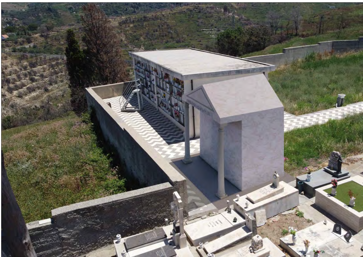
Vista 1 - ipotesi di progetto