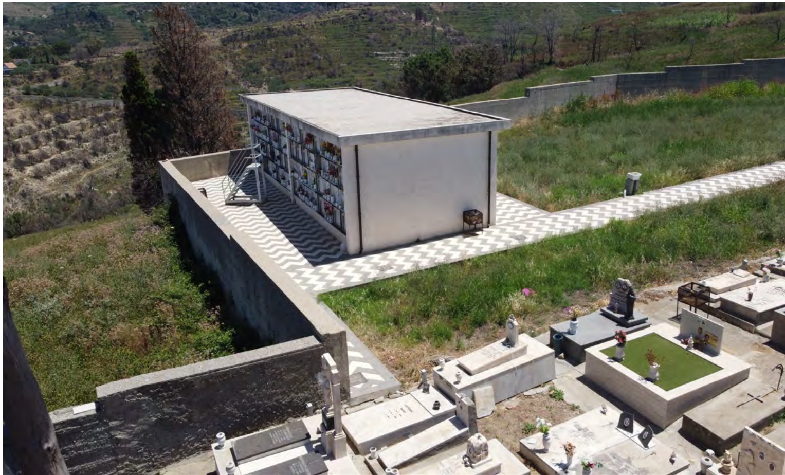
Vista 1 - stato di fatto