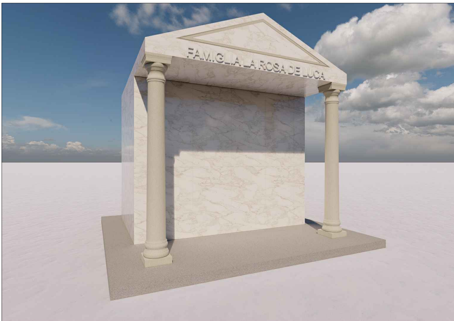
Vista 3 - ipotesi di progetto