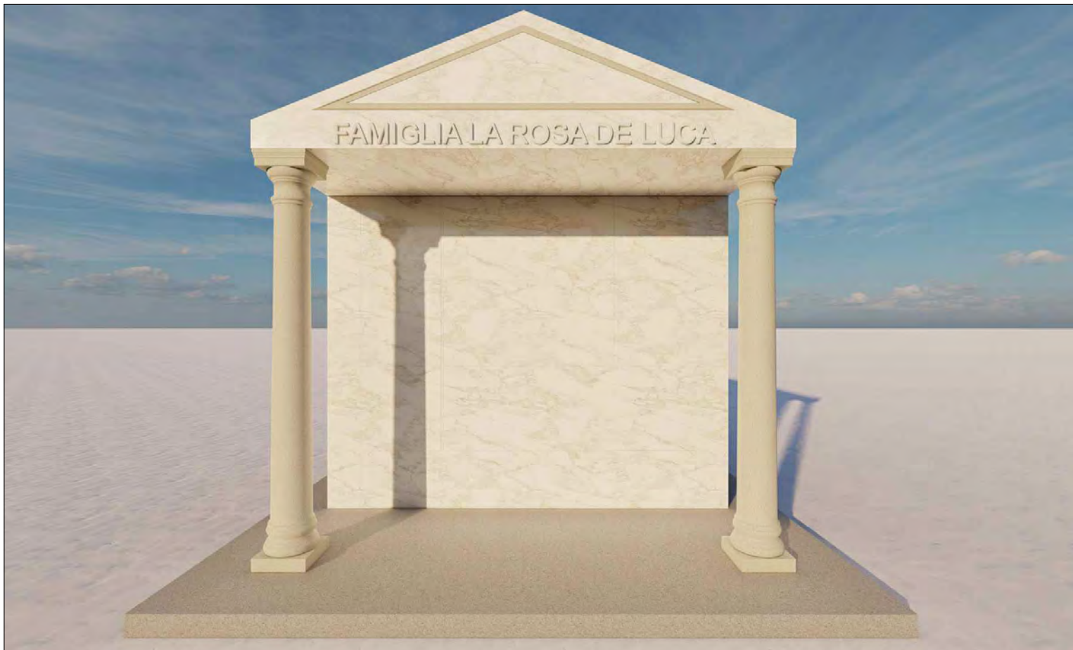
Vista 2 - ipotesi di progetto